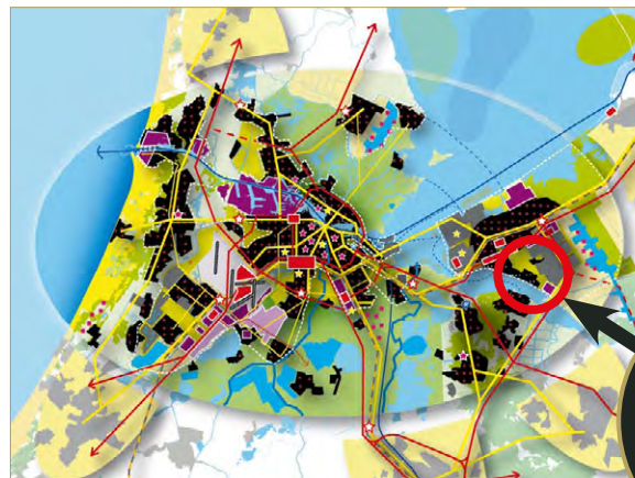
Plan Metropoolregio Amsterdam